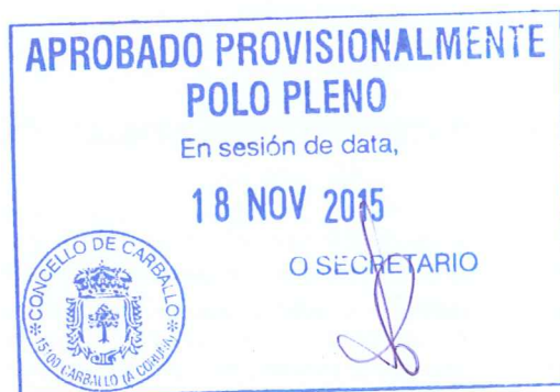
Fdo.: Álvaro Fernández Carballada

XUNTA DE GALICIA Aprobado definitivamente por Orde da Conselleira de Medio Ambiente e Ordenación do Territorio